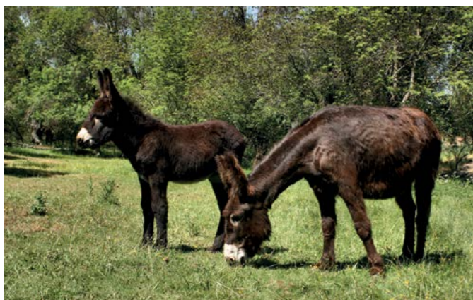
ÍCARO 25 de Março de 2013 Mãe Santulhana Pai Zêzere