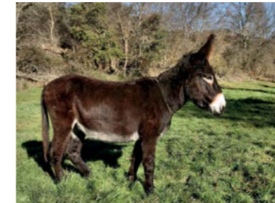
DULCINEIA, A COMPANHEIRA Nascimento 06/03/2008

O Dom Quixote regressou a Atenor depois de passar grande parte do ano a colaborar com a Associação Rio Vivo no projecto "O futuro num dorso ecológico". Em conjunto com o burro Damien, aprendeu a puxar o arado e a carroça, e foi uma grande ajuda no festival Tempo d'Aldeia!