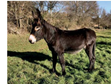
GAIVOTA, A VIGOROSA Nascimento 20/04/2011

A Dulcineia, irmã gêmea do Dom Quixote, é uma verdadeira companheira, não havendo passo que dê sem a Daina. É uma das parelhas mais notáveis do Centro, já que andam sempre juntas, tanto na hora da brincadeira como das refeições - ficam lado a lado a partilhar a aveia e o feno!