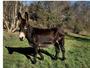
DOM QUIXOTE, O APRENDIZ Nascimento 06/03/2008

O Dom Quixote regressou a Atenor depois de passar grande parte do ano a colaborar com a Associação Rio Vivo no projecto "O futuro num dorso ecológico". Em conjunto com o burro Damien, aprendeu a puxar o arado e a carroça, e foi uma grande ajuda no festival Tempo d'Aldeia!