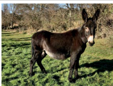
CUCA, A SERENA Nascimento 11/04/2003