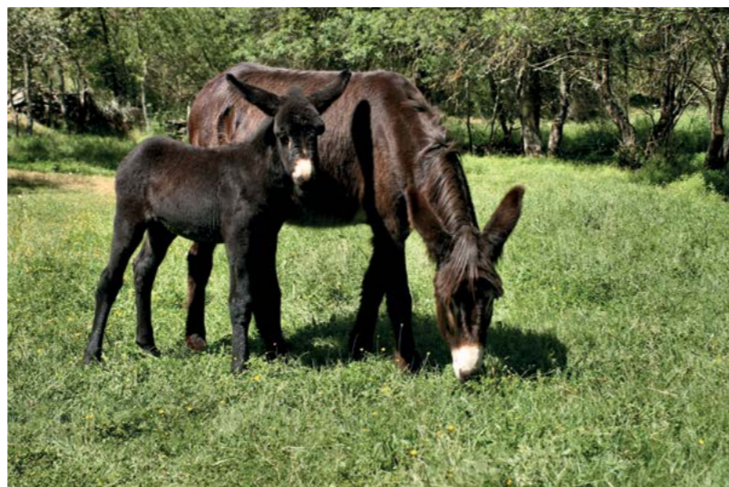
INÁCIO 20 de Abril de 2013 Mãe Bulhaca Pai Zêzere