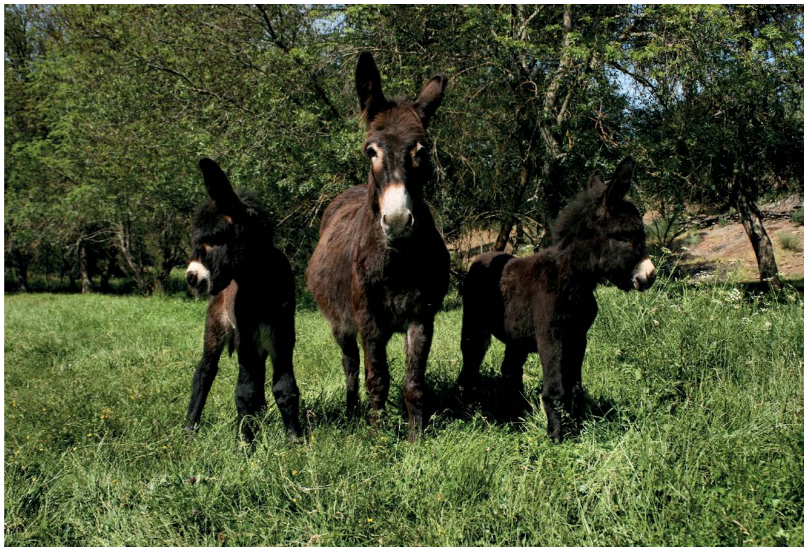
ILHÓ 8 de Abril de 2013 Mãe adoptiva Cabaça Mãe Guimarães Pai Zêzere