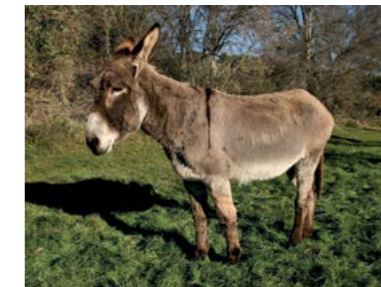
TÓ, O TRANQUILO Nascimento Outubro 2003

A Hera foi a última burrinha a entrar na Campanha de Apadrinhamento, e neste último ano cresceu muito rápido, tendo-se feito alta e muito bonita. Apesar de andar sempre acompanhada pelas amigas Gaivota e Gorongosa, não deixa de procurar a atenção dos tratadores e dos visitantes para receber carinhos.