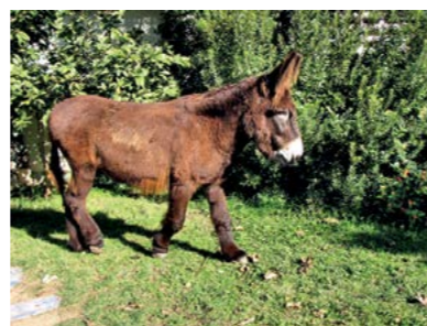
BUXO, A VEDETA Nascimento 10/05/2006

A Bulhaca é muito dócil e este ano voltou a ser mãe de um lindo burrinho chamado Inácio. Sempre preocupada, não o perde de vista quando se escapa para a brincadeira, controlando todos os seus movimentos e traquinices. No final do dia, aconchega-o junto a ela para partilharem a aveia que o tratador lhes deu.