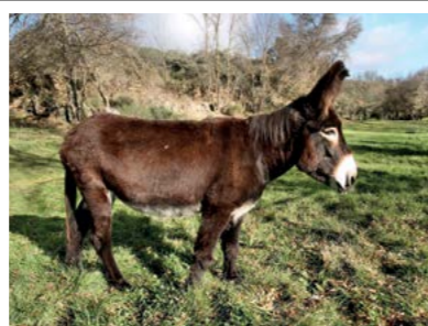
DAINA, A TEIMOSA Nascimento 2008

A Cuca é uma das burras mais bonitas do Centro de Valorização do Burro de Miranda. Sempre muito recatada, é uma burra de fácil trato. Gosta do seu sossego e nunca procura confusões nem desacatos. Está prenha e, se tudo correr bem, em meados de Abril trará mais uma linda cria ao Centro!