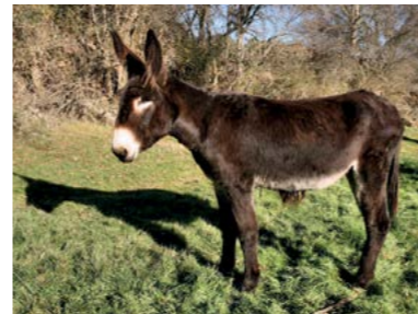
GORONGOSA, A CASMURRA Nascimento 15/05/2011

A Gaivota é parecida com a sua mãe Serralves, robusta e cheia de energia. Ao contrário da calma que aparentava ter durante a infância, hoje a Gaivota mostra-se uma burra bastante determinada e irrequieta. Todos os dias parte à descoberta dos lameiros que ladeiam o estábulo na procura da melhor erva ou de uma nova brincadeira.