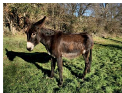
BULHACA, A AMOROSA Nascimento 23/02/2006

O Atenor, um dos burros mais viajados da associação, tem um tique bastante particular: deixa toda a gente que o visita a sorrir, pois uma das coisas que mais gosta de fazer é pôr a sua língua comprida de fora como se estivesse a saborear o vento!