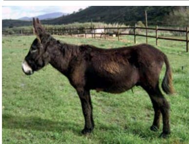
CALIMERO, O CONQUISTADOR Nascimento 20/02/2007

O Buxo já é bastante conhecido por todos os que visitam a Quinta Pedagógica dos Olivais em Lisboa. Já lá vão 6 anos desde que tomou a decisão de ir para a capital. É muito acarinhado pelos tratadores e por toda a equipa da Quinta, pois não há dia em que o seu zurro não se faça ouvir, pedindo atenção e mimos aos que por ali passam.