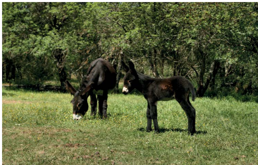
IBÉRIA 28 de Maio de 2013 Mãe Dália Pai Curro