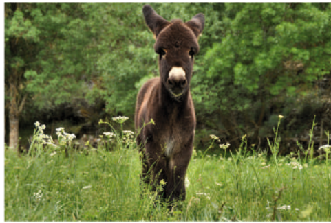
HÉRCULES Pai: Curro Mãe: Deolinda 7 | MAIO | 2012