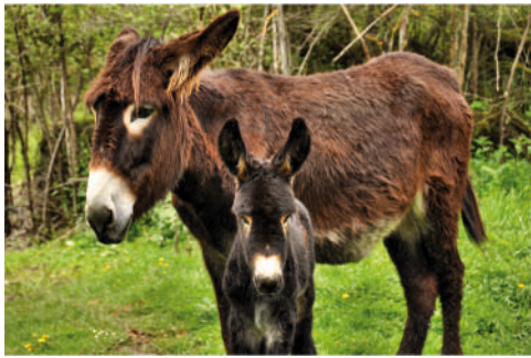
HOMERO Pai: Curro Mãe: Maceda 5 | MAIO | 2012

A cada ano corresponde uma letra de registo no Livro Genealógico: em 2012 foi a letra H e em 2013 será a letra I