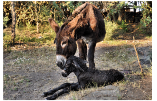
HORÁCIO Pai: Zuck Mãe: Outeira 30 | MAIO | 2012