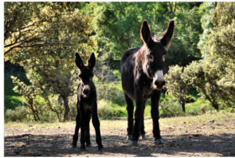
HERA Pai: Zuck Mãe: Dora 20 | MAIO | 2012