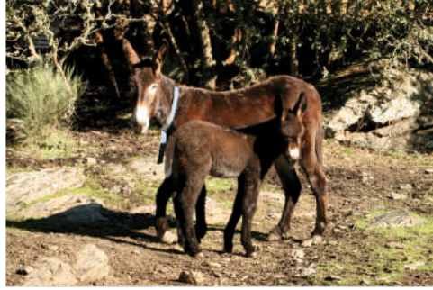
HIMALAIA Pai: Zuck Mãe: Olivia 20 | OUTUBRO | 2012