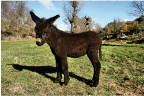
HISTÓRIA Pai: Zuck Mãe: Castanha 4 | SETEMBRO | 2012