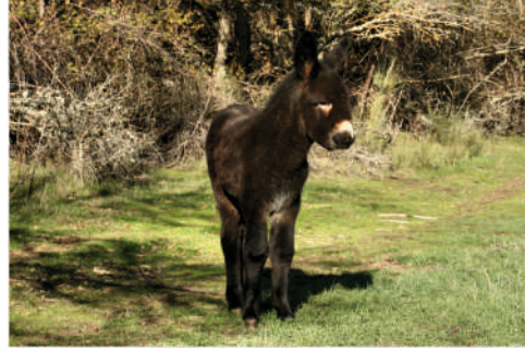
HORTA Pai: Zuck Mãe: Liberdade 27 | OUTUBRO | 2012