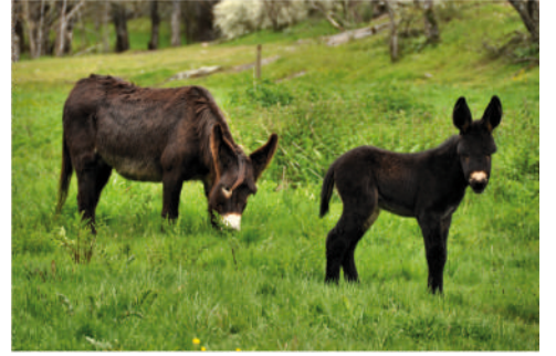
HORTELÃ Pai: Curro Mãe: Andorinha 24 | ABRIL | 2012